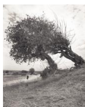
Separate, Together, Mundemu, Tanzania, 2017. Aus der Serie »From Where Loss Comes«, Platinum-palladium (1:1) Abzug vom Originalnegativ