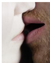
Cat Person, 2017

Veranstaltungsort: Fotografie Forum Frankfurt, Braubachstr. 30–32, 60311 Frankfurt