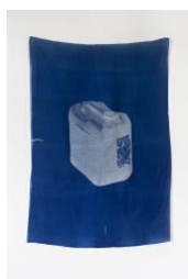
Aus dem Projekt »CORRESPONDENCE« (2021)