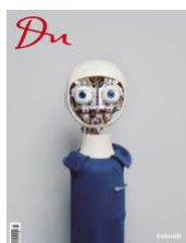
Cover Magazin »Du«, Ausgabe 863