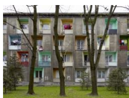
o.T. 1 (Nowa Huta), 2010–2011

© Götz Diergarten / VG Bild-Kunst, Bonn 2021 / Courtesy Kicken Berlin